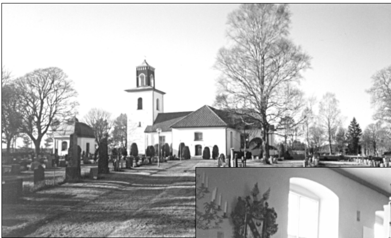
■ Pirms koncerta Svenarumas baznīcā

7. aprīlis iesākas ar pieņemšanu Vageridas komūnas sēžu zālē. Ar apsveikuma vārdiem mūs uzrunā pašval-