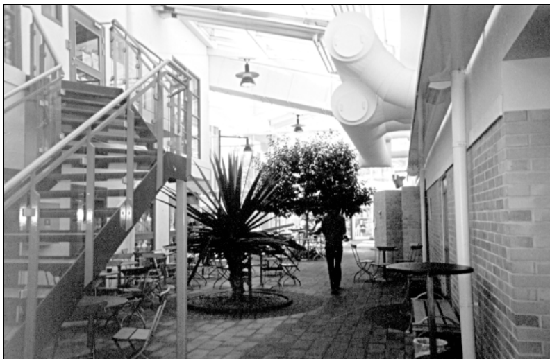
■ Fēniksa ģimnāzijas vestibils

Pēc atgriešanās Vageridā braucam uz Svenaruma baznīcu, kur pirms koncerta vēl nedaudz izmēģinām balsu skanējumu. Tad vakariņas draudzēs mājā un pirmais publiskais koncerts. Baznīcā ir samērā daudz klausītāju, un