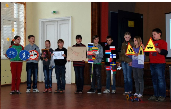
Projektu nedēļas Transports uzvarētāji – 2.un 4.klase prezentē savus projektus.