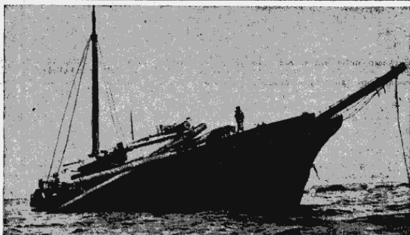
Kolkas sēklī izmests motorburinieks.