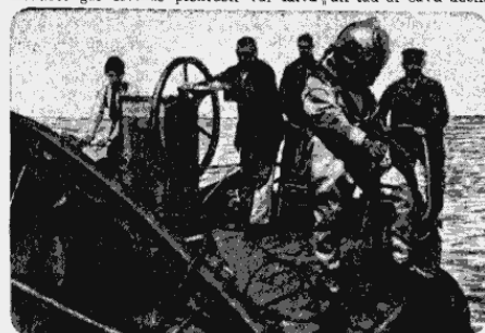
Ūdenslīdēji sagatavoja nirti jūrā, lai apskatītu avarējušā kuģa zemūdens daļas.