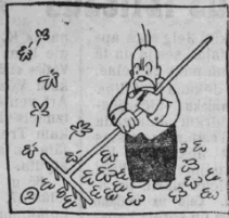
Adamsons no paša rīta Neatīdābība un spītā Grābji un grābji; kad nevedas, Smagās domas uzņemas.