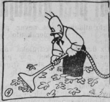
Technika ar milzu soļiem Sleidz pa dubļiem un pa oļiem, Adamsons to talkā lūdz, Tā vis negrābji vairs - bet sūc.