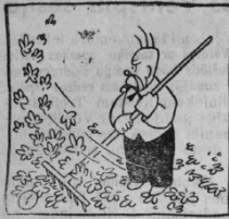
Rudens nežēlīgu roku Nopļūcinā katru koku. Noskūti lapas, gaisā griež, Izvalda un zeme avēz.