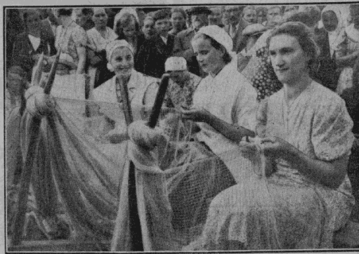
Tiklu iapitājas sacensības.

Kolkasragā svētdien pulcējās zvejnieku saime no visiem apkārtnējiem ciemiem. Sarādās pušķotas motorlaivas, airētāji, zēģelētāji, gājēji un braucēji pa zemesceļiem. Vistālākie viesi bija Slokas jūrmalas zvejnieki, kas atbrauca smagā automašīnā no 150 km attālā Lapmežciema. Lai vērotu dažādas zvejnieku darba sacikstes, jūras krastā pulcējās pāri par 1000 cilvēku. Tādu lauju pieplūdumu Kolkasrags vēl nebija piedzīvojis.