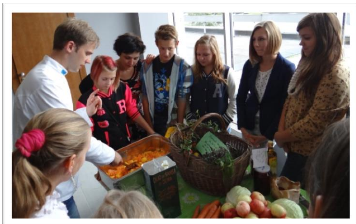
ŠEIT APLŪKOJAM GARDOS SALĀTUS