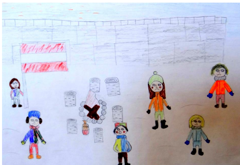
Zīmējums: Nadina Linita Kevrele

Uzzinājām, ka daudzi kolcinieki bija piedalījušies Barikādēs Rīgā. Mēs noskatījāmies filmu par Barikāžu laiku, zīmējām zīmējumus. Visu klašu skolēni izveidoja izstādes par Barikāžu dienu notikumiem. Foto galerija