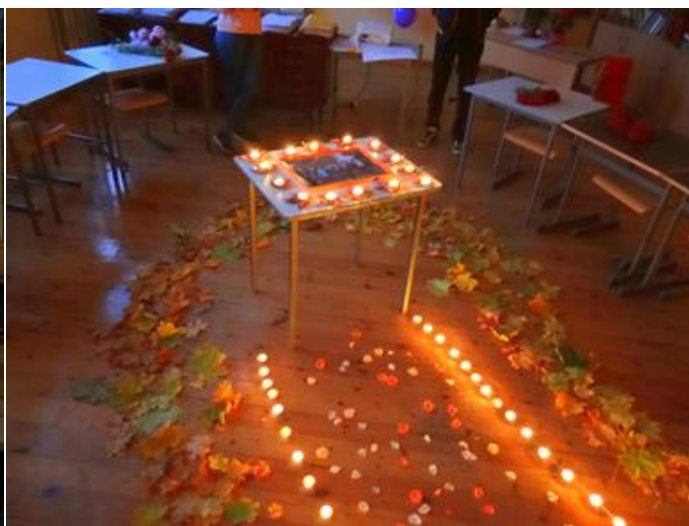
Foto: Bērni sagādā pārsteigumus skolotājai A.Brandei dzimšanas dienā