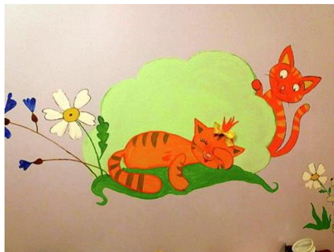
Fantastiskie internāta "Rūķu nams" audzinātājas S.Libreihas sienu zīmējumi