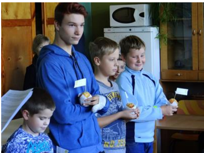
Foto: Jubilāru sveikšana dzimšanas dienā