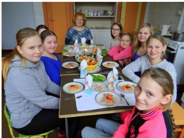
Foto: Skolotājas I.Šelkovas meitenes direktori dzimšanas dienā pārsteidz ar svētku svinību galdu