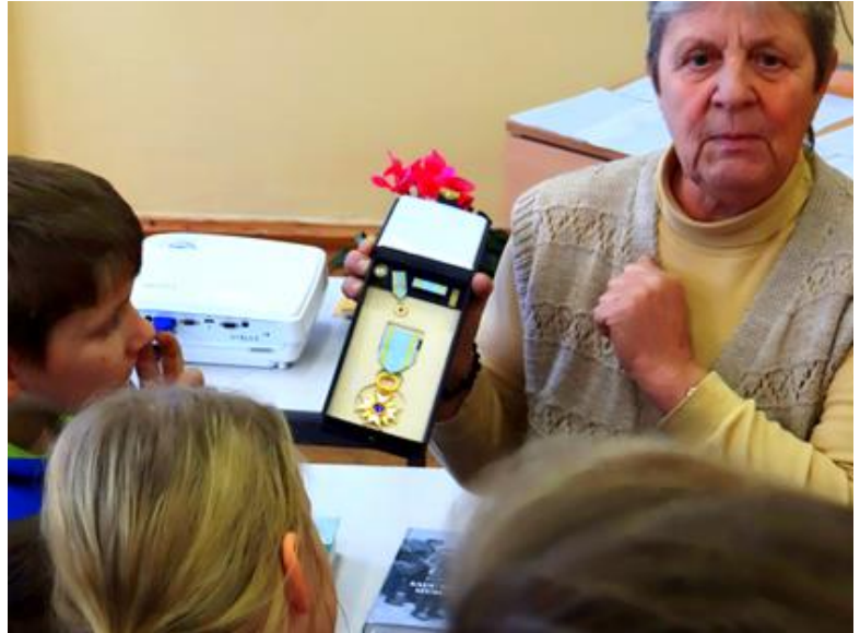
Foto: Skolā viesojas Triju zvaigžņu ordeņa īpašniece rakstniece Baiba Šuvcāne . Viņa bērniem pastāstīja, kā šo augsto apbalvojumu saņēmusi no valsts prezidenta Raimonda Vējoņa

Foto: Kolkas pamatskolai 11. Zaļais karogs. Zaļās komitejas meitenes devās uz Rīgu, lai saņemtu šo augstāko EKOscolu apbalvojumu