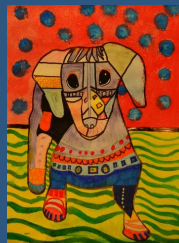
Darbi no Talsu kinoloģijas kluba zīmējumu konkursa „Sapņu suns”