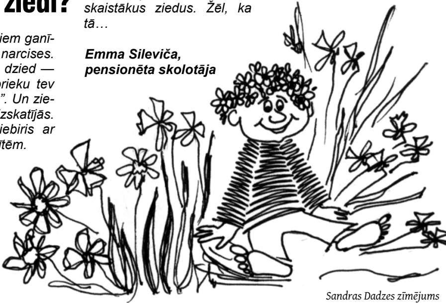
Sandras Dadzes zīmējums