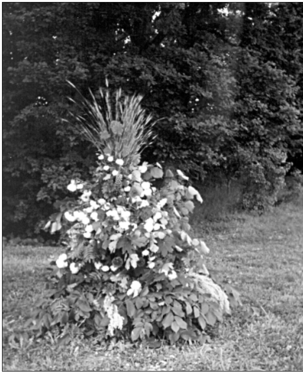
■ Ziedu ugunskurs.

B.K.: — Zinām, ka magones nedrīkst audzēt, bet kādreiz jau izaug. Nu, ja nāk pār žogu viens ar nazīti rokās pie magones — lai nāk, nogriezīs un aizies. Tagad ir posts ar metālu, jo netālu atrodas uzpirkšanas vieta.