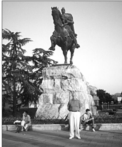
■ Pieminēklis Albānijas brīvības cīnītājiem