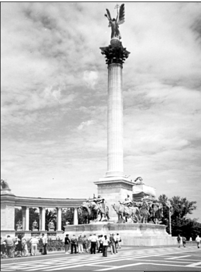
■ Varoņu laukumā Budapeštā ■ Vīna kiosks no vīna mucas.

Līdztekus pašvaldībām nedaudz iepazīnāmies ar galvenajām nozarēm — lauksaimniecību, augkopību, tūrismu.