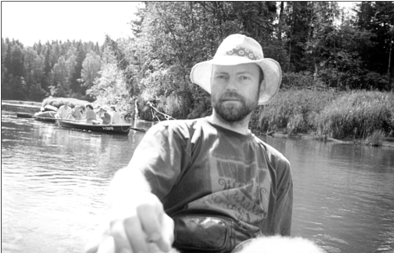
■ Pie ūdeņiem.

— Nedomāju, ka man vajadzētu padomus dot. Protams, zināmi secinājumi ir radušies. Visiem Latvijas laukiem ir kas kopīgs. Iedomāsimies šādu līdzību. Ja cilvēkam nav naudas, viņš savu dzīvokli labākajā gadījumā var kosmētiski izremontēt. Nabadzīgs cilvēks var sakopt apkārtni, būt tīrs, kārtīgs un godājams cilvēks. Bet — tas ir arī viss. Ja ir kāds, kas finansē, tad var darīt lielas lietas. Tā ir arī Dundagas gadījumā. Ja Dundagai piešķirts sakoptākā pagasta nosaukums, tad acīmredzot salīdzinājumā ar citiem pie mums daudz maz valda kārtība. Ja būtu finansējums (un es ticu, ka ne pārāk tālā nākotnē tā arī būs!), tad te daudz ko varētu izdarīt. Pat zemes auglība nav pilnīgs kritērijs. Esmu bijis Īrijā, Norvēģijā. Kas tur no laukiem novāktu akmeņus! Un cik auglīgas ir mūsu jūrmalas smilšainās augšneses? Ja brauc pa Anglijas ceļiem, vējstikls mašīnai ir pilnīgi tīrs. Pie mums — drīz vien pilns ar kukaiņiem.